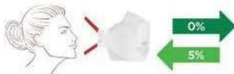
MASCHERINA FFP3 SENZA VALVOLA (indicata per gli operatori sanitari)