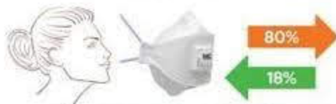
MASCHERINA FFP2 CON VALVOLA

(indicata per gli operatori sanitari da indossare con visiera protettiva)