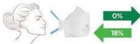
MASCHERINA FFP2 SENZA VALVOLA