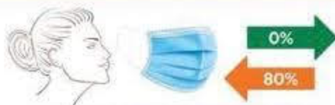
MASCHERINA CHIRURGICA A TRE VELI