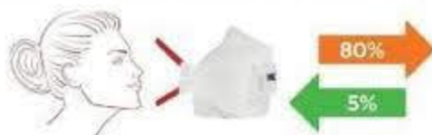
MASCHERINA FFP3 CON VALVOLA

(indicata per gli operatori sanitari da indossare con visiera protettiva)